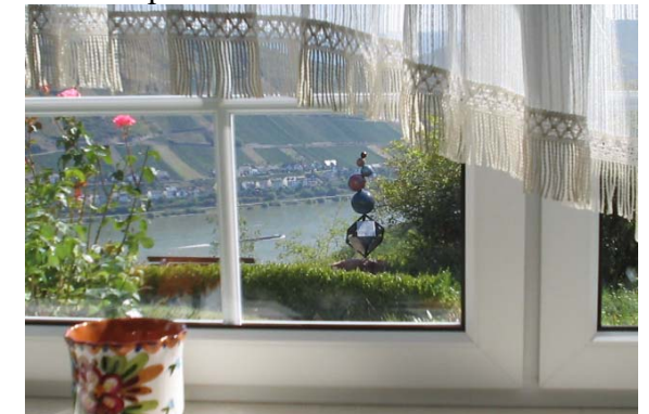
Vue sur le Rhin de la chambre de séjour

Vacances pour 2 à 4 personnes près de Bacharach sur les collines de la fascinante région de la vallée moyenne du Rhin, inscrit dans la liste du patrimoine culturel mondial de l'UNESCO : Appartement à 2 chambres avec cuisine et bain, entrée séparée et une vue directe sur le Rhin.