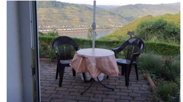
Perspective de terrasse

Vacances pour 2 à 4 personnes près de Bacharach sur les collines de la fascinante région de la vallée moyenne du Rhin, inscrit dans la liste du patrimoine culturel mondial de l'UNESCO : Appartement à 2 chambres avec cuisine et bain, entrée séparée et une vue directe sur le Rhin.