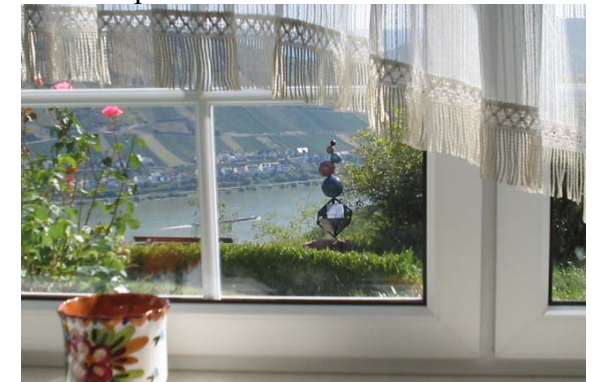
Vue sur le Rhin de la chambre de séjour

Appartement à 2 chambres avec cuisine et bain, entrée séparée et une vue directe sur le Rhin.