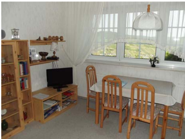
Vue partielle de la salle de séjour

Les linge de lit, des serviettes, internet, téléphone et frais accessoires sont incluses.