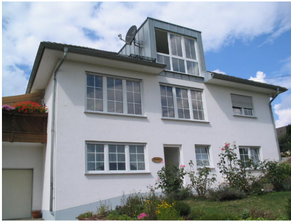
Maison avec l'entrée à l'appartement