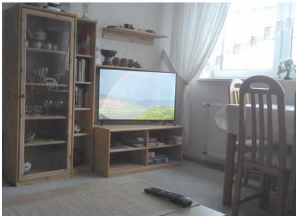
Vue partielle de la salle de séjour

Les linge de lit, des serviettes, internet, télé- phone et frais accessoires sont incluses.